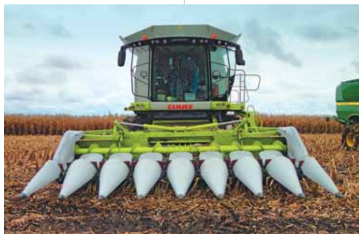
Фото 1. Зернозбиральний комбайн Lexion 770 з кукурудзяною жаткою Conspeed 8-70 FC на полях групи компаній «Росток Холдинг»

(табл. 1). Цей комбайн розрахований на те, щоб збирати багато та в найшвидші терміни. Але наскільки ця машина ефективна в реальних умовах, коли в'язкий чорнозем забирає значну частину