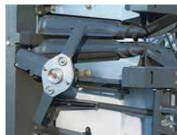
Фото 2. Конічні початковідокремлюючі вальці та система подрібнення стебел кукурудзи жниварки Conspeed 8-70 FC

Керування зернозбиральним комбайном – завдання не з