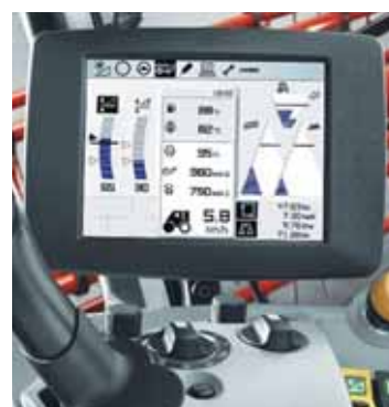
Фото 3. Електронна бортова інформаційна система CEBIS зернозбирального комбайна Lexion 770 від компанії Claas