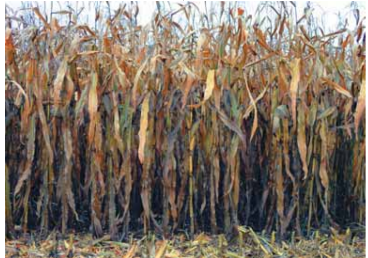
Фото 4. Поле кукурудзи на зерно для тестування комбайну Lexion 770

Слід відзначити, що SEBIS не єдина електронна система, що допомагає комбайнеру. У своєму арсеналі Claas має ще дві електронні системи, які, окрім виконання вказаних вище функцій, частково або повністю перебирають керування основними системами комбайна на себе. Це SEMOS Dialog та SEMOS Automatic. Перша з них, SEMOS Dialog, базується на діалоговому принципі керування. Тобто операторові, залежно від його запиту, пропонуються оптимальні налаштування, які він може як прийняти, так і відхилити. SEMOS Automatic – це автоматична система оптимізації роботи комбайна. Принцип роботи системи доволі простий, однак надзвичайно ефективний: після початку роботи комбайна в полі система регулює певні попередньо задані параметри і через короткий час визначає оптимальні налаштування для робочих систем машини. У процесі роботи ці налаштування постійно перевіряються системою та адаптуються відповідно до умов збирання, що змінюються. Таким чином, SEMOS Automatic забезпечує безпервне оптимальне налашту-